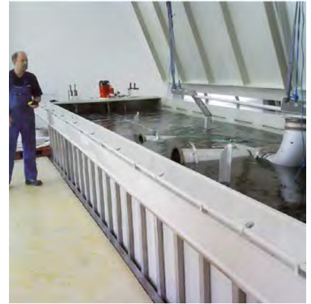
Pickling Bath 302