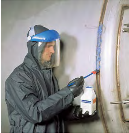
BlueOne™ Pickling Paste 130