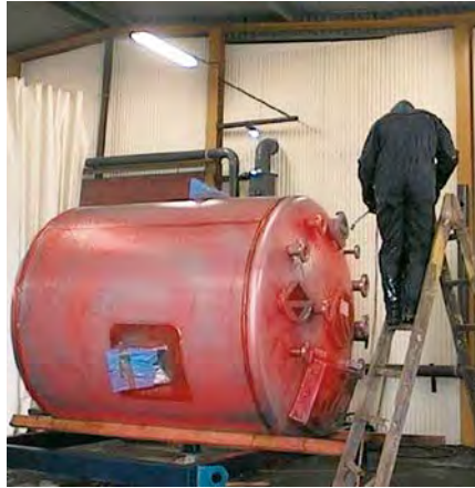
RedOne™ Pickling Spray 240